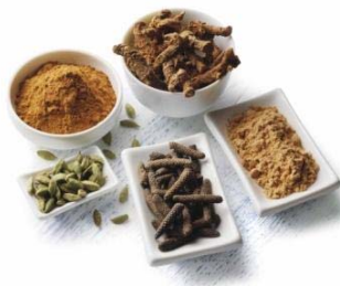
Tibetische Kräuter für Psyche, Herz und Verdauung.

Weitere Infos beim Padmaforum: Risiko- und Typentest auf www.padmaforum.at (Tipps und Termine), kostenlose Broschüre anzufordern unter 0664/106 42 04.